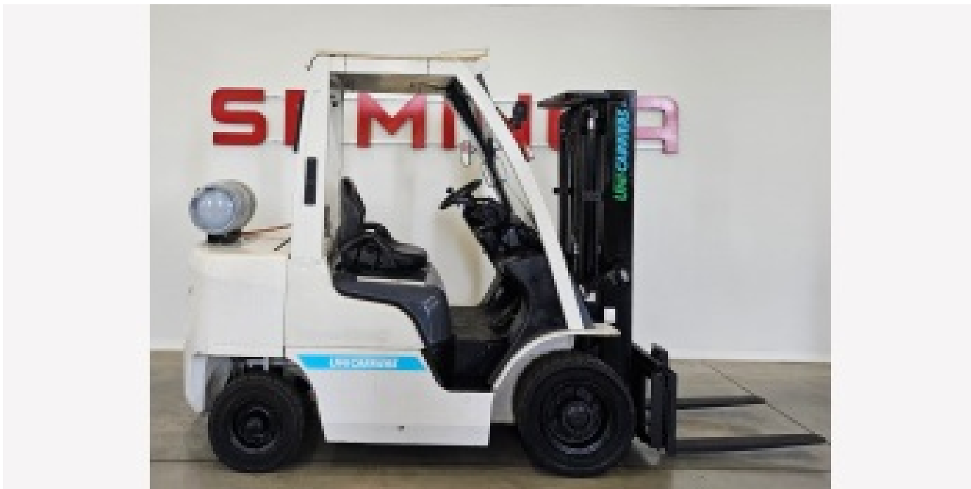
10024 UNICARRIERS P1F2A25D