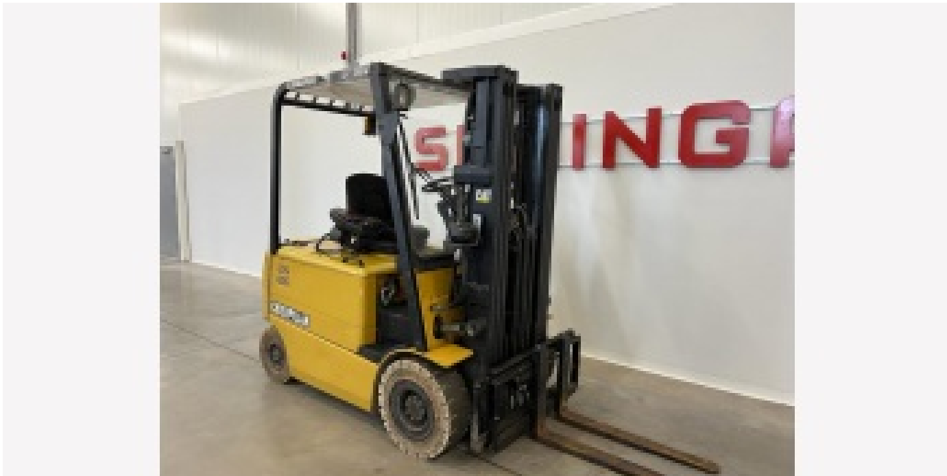
10071 CATERPILLAR EP25K