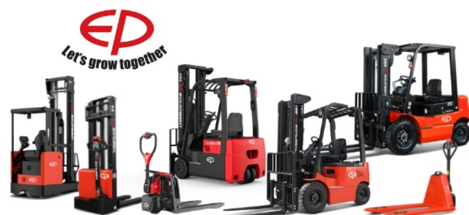
NAUJI EP EQUIPMENT KRAUTUVAI