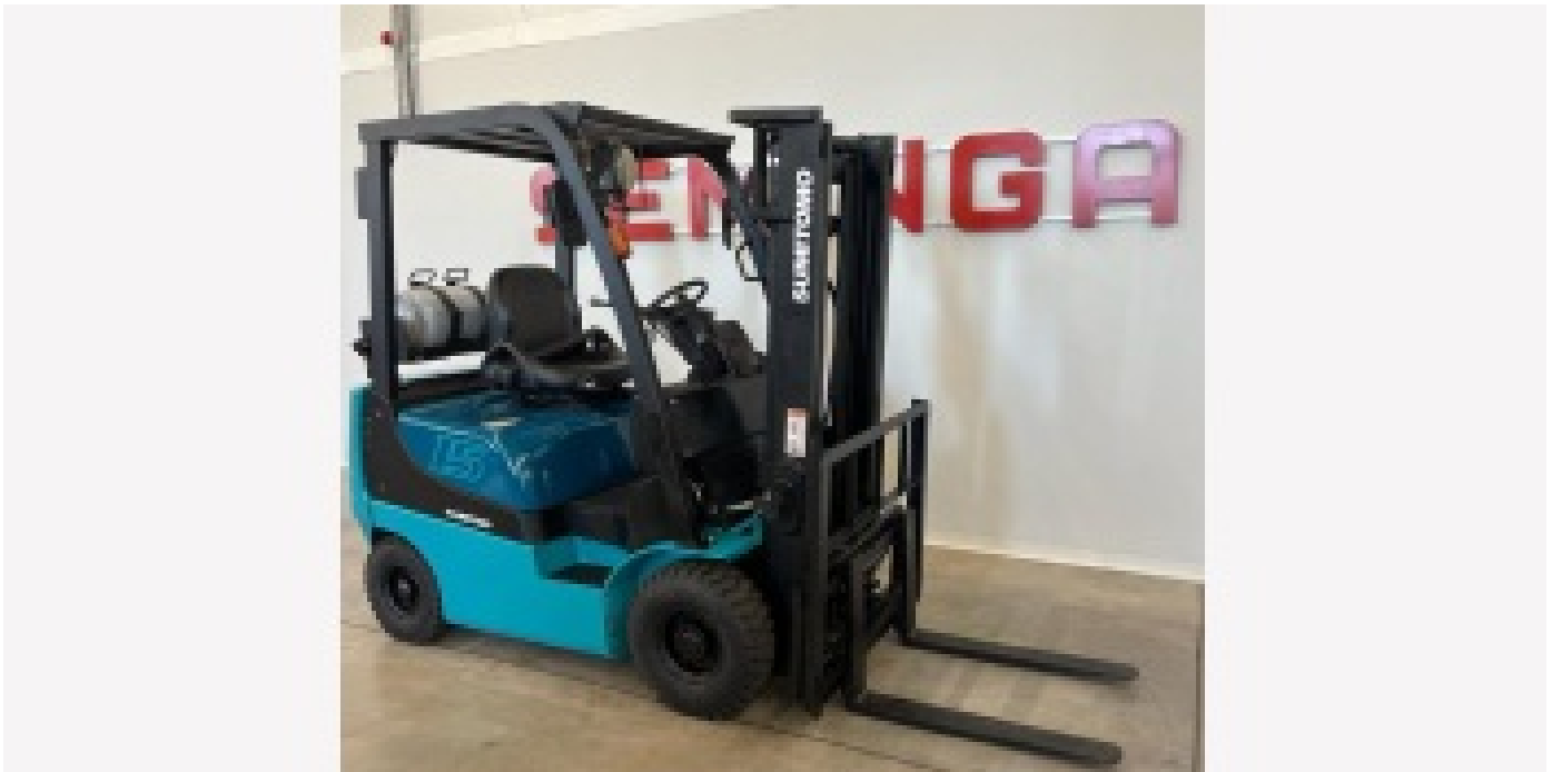
10021 SUMITOMO 03-FL15PAXI2LD