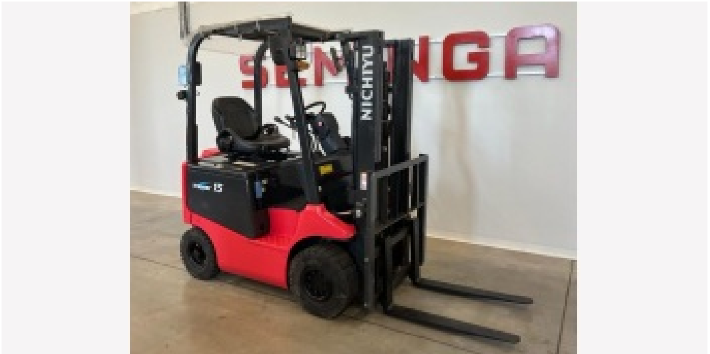
9981 NYK (NICHYU) FB15PN-77-300PFL